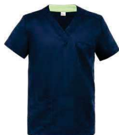
Z48 Blu Blue