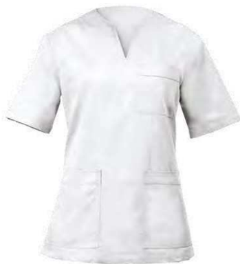
C01 Bianco White