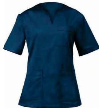
Z48 Blu Blue