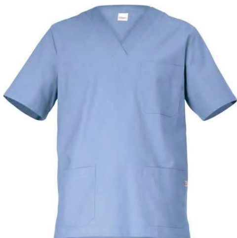
M18 Azzurro Light blue