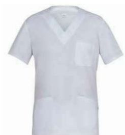
C01 Bianco White