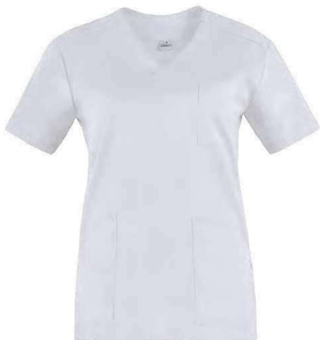
C01 Bianco White