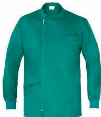
D29 Verde Green