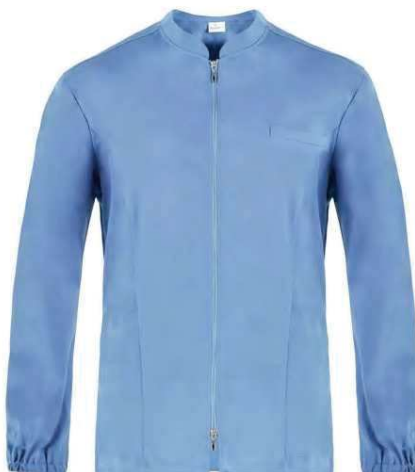
M18 Azzurro Light blue