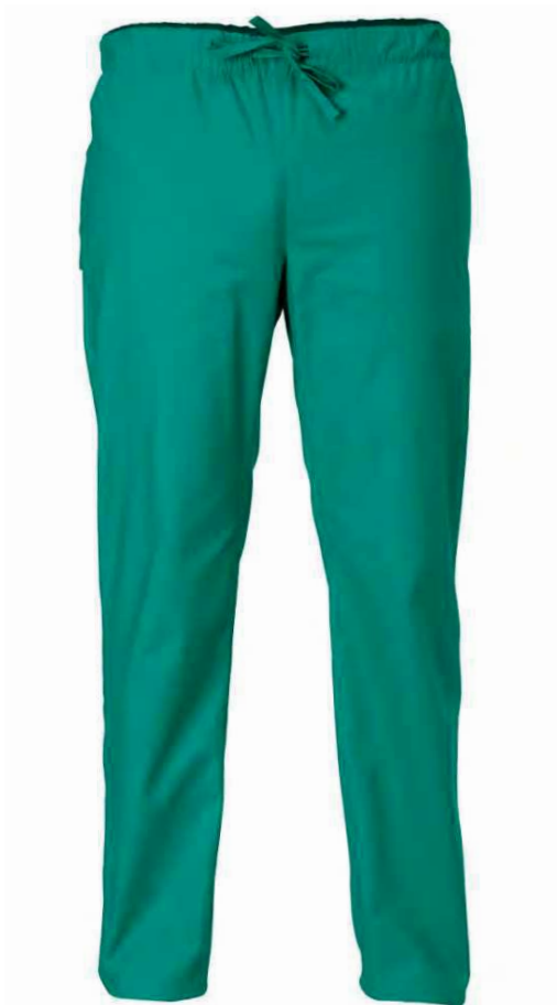
D29 Verde Green