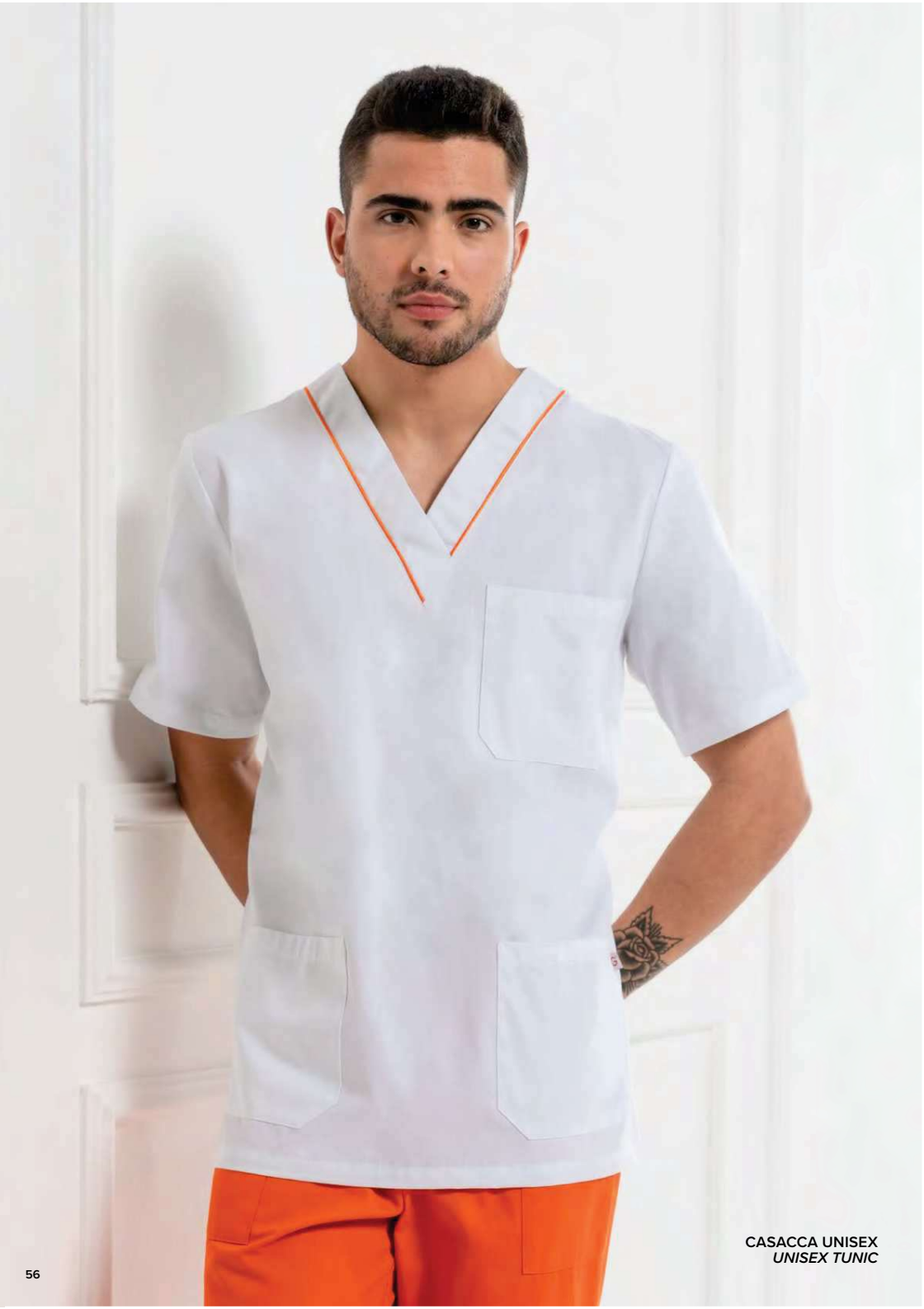
CASACCA UNISEX UNISEX TUNIC