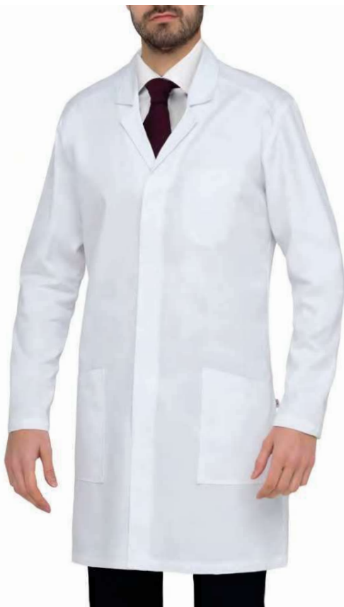
C01 Bianco White