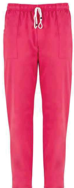
Z46 Fucsia Fuchsia