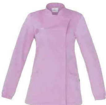
C07 Lilla Lilac