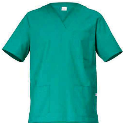
D29 Verde Green