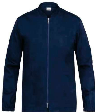
Z48 Blu Blue