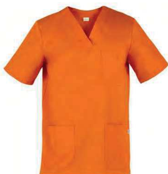
D24 Arancio Orange