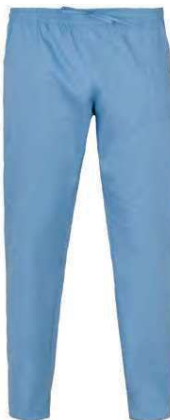
M18 Azzurro Light blue