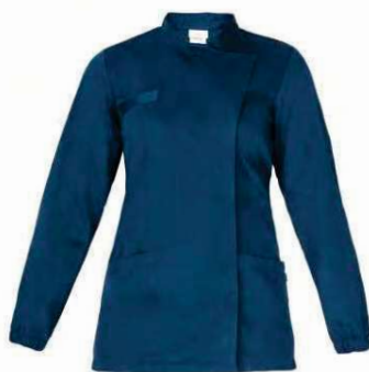
Z48 Blu Blue