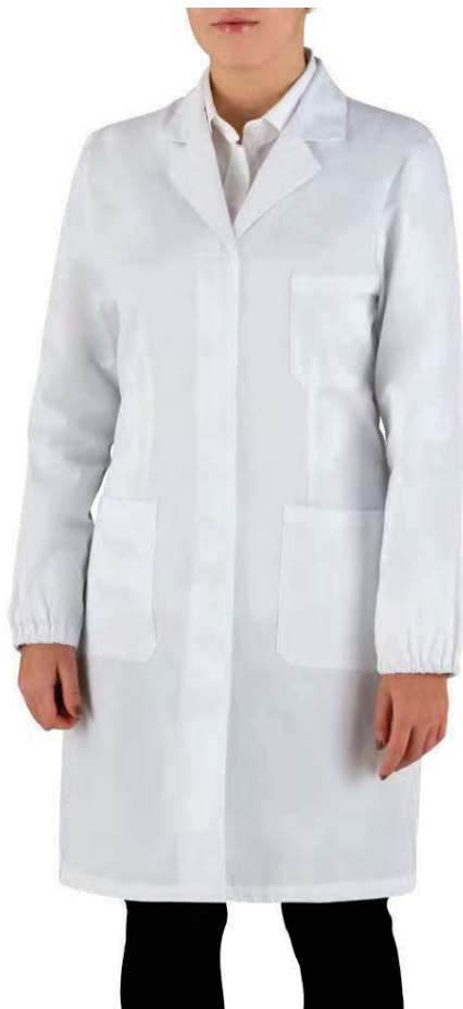
C01 Bianco White