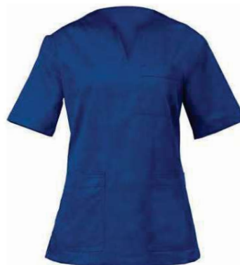
U38 Bluette Royal