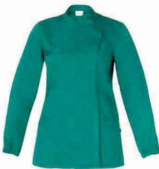
D29 Verde Green