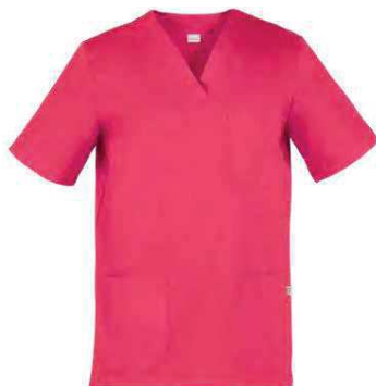
Z46 Fucsia Fuchsia