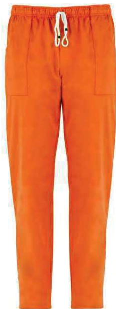
D24 Arancio Orange