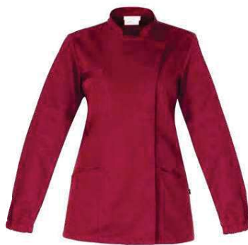
U35 Bordeaux Burgundy