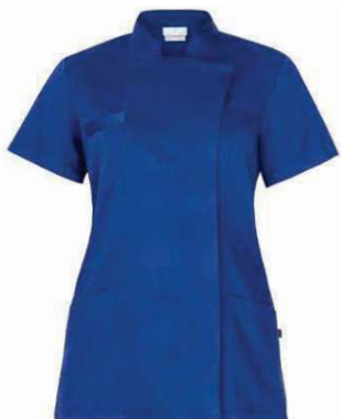
U38 Bluette Royal