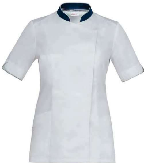
P48 Bianco Blu White Blue

P48 Bianco Blu / White Blue P29 Bianco Verde / White Green