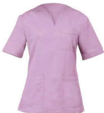
C07 Lilla Lilac