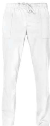
C01 Bianco White