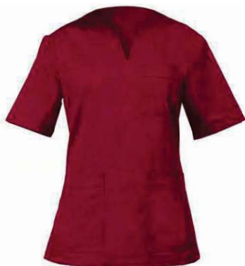
U35 Bordeaux Burgundy