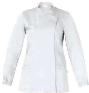
C01 Bianco White