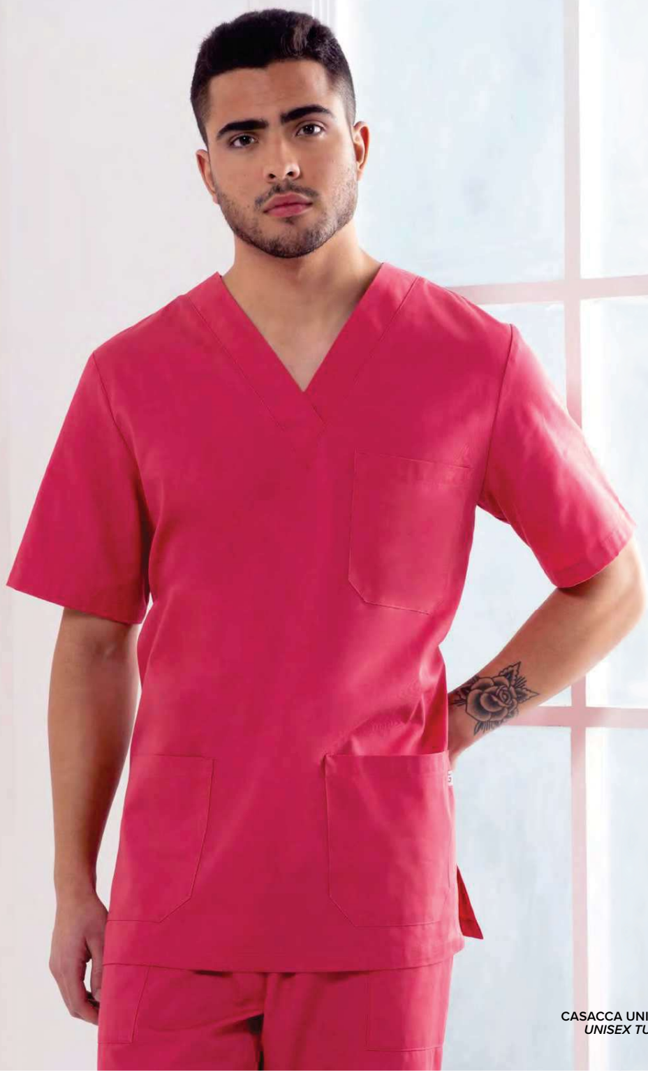
CASACCA UNISEX UNISEX TUNIC