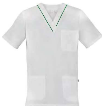
P29 Profilo verde Green piping