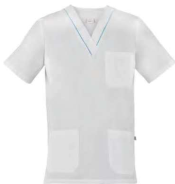
P18 Profilo azzurro Light blue piping