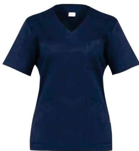
Z48 Blu Blue