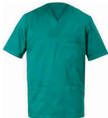
D29 Verde Green