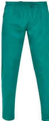
D29 Verde Green