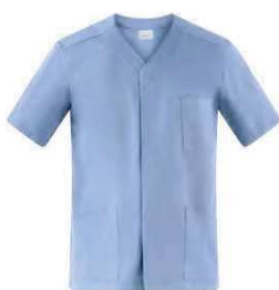
M18 Azzurro Light blue