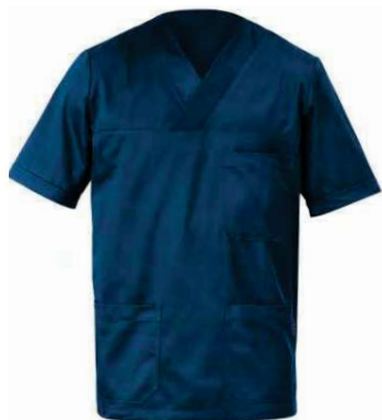
Z48 Blu Blue