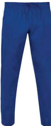
U38 Bluette Royal