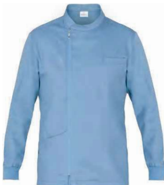
M18 Azzurro Light blue