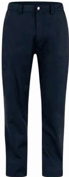
U32 Nero Black