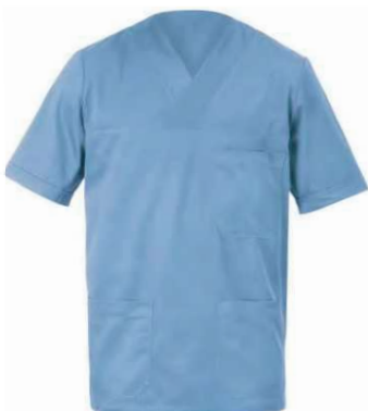
M18 Azzurro Light blue