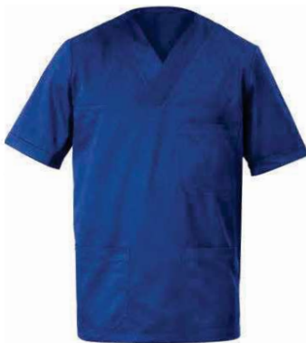
U38 Bluette Royal