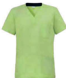
C09 Pistacchio Pistachio