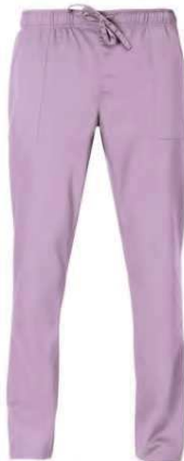
C07 Lilla Lilac