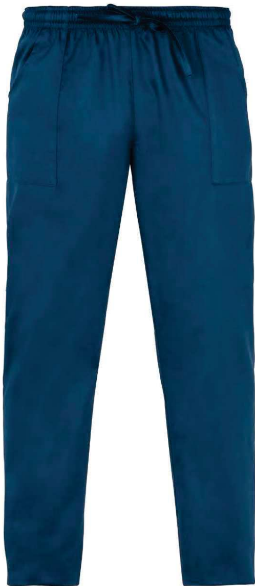
Z48 Blu Blue