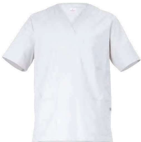
C01 Bianco White