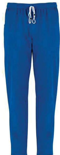
U38 Bluette Royal