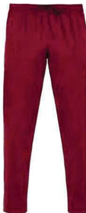
U35 Bordeaux Burgundy