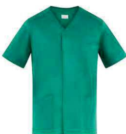
D29 Verde Green