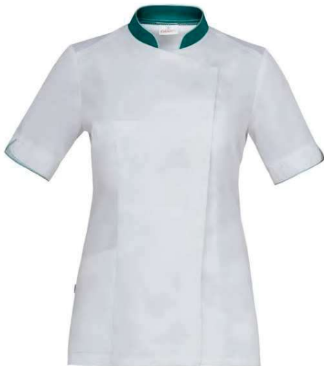
P29 Bianco Verde White Green