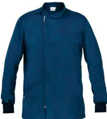
Z48 Blu Blue