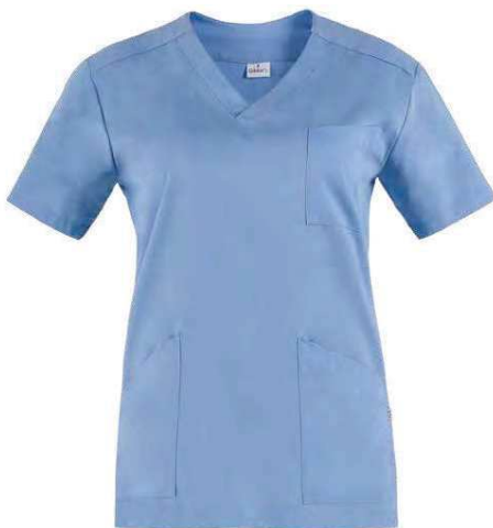
M18 Azzurro Light blue