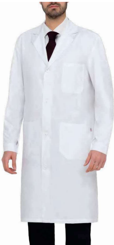
C01 Bianco White