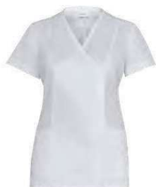
C01 Bianco White