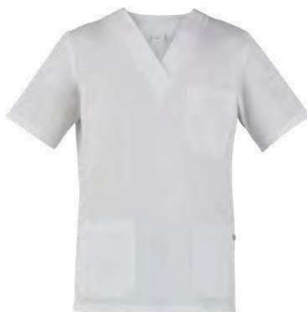
C01 Bianco White