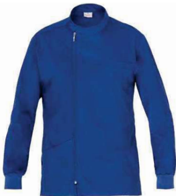
U38 Bluette Royal