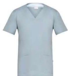
C02 Grigio chiaro Light grey