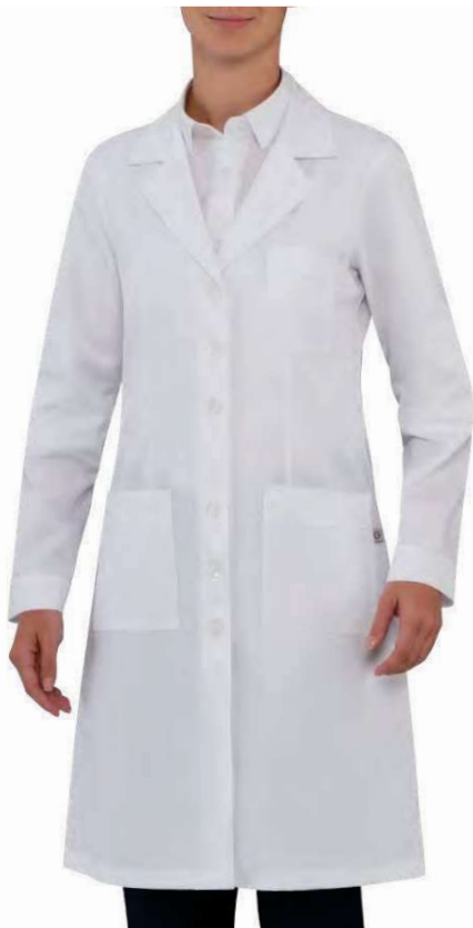
C01 Bianco White