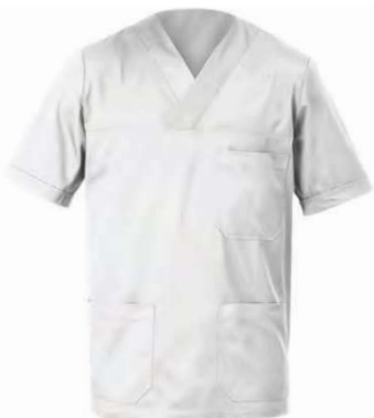
C01 Bianco White