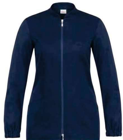
Z48 Blu Blue