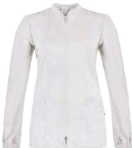
C01 Bianco White