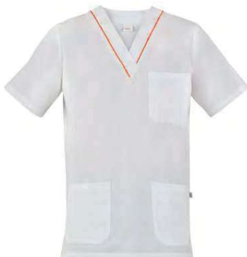
P24 Profilo arancio Orange piping