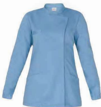
M18 Azzurro Light blue