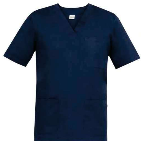
Z48 Blu Blue