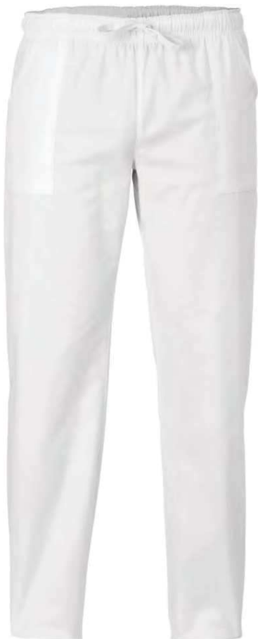
C01 Bianco White