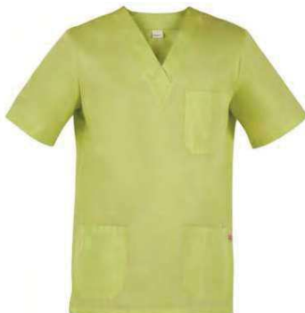
C09 Pistacchio Pistachio