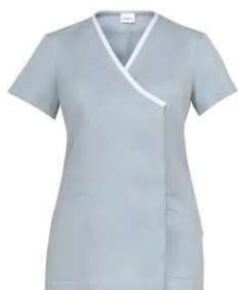
C02 Grigio chiaro Light grey