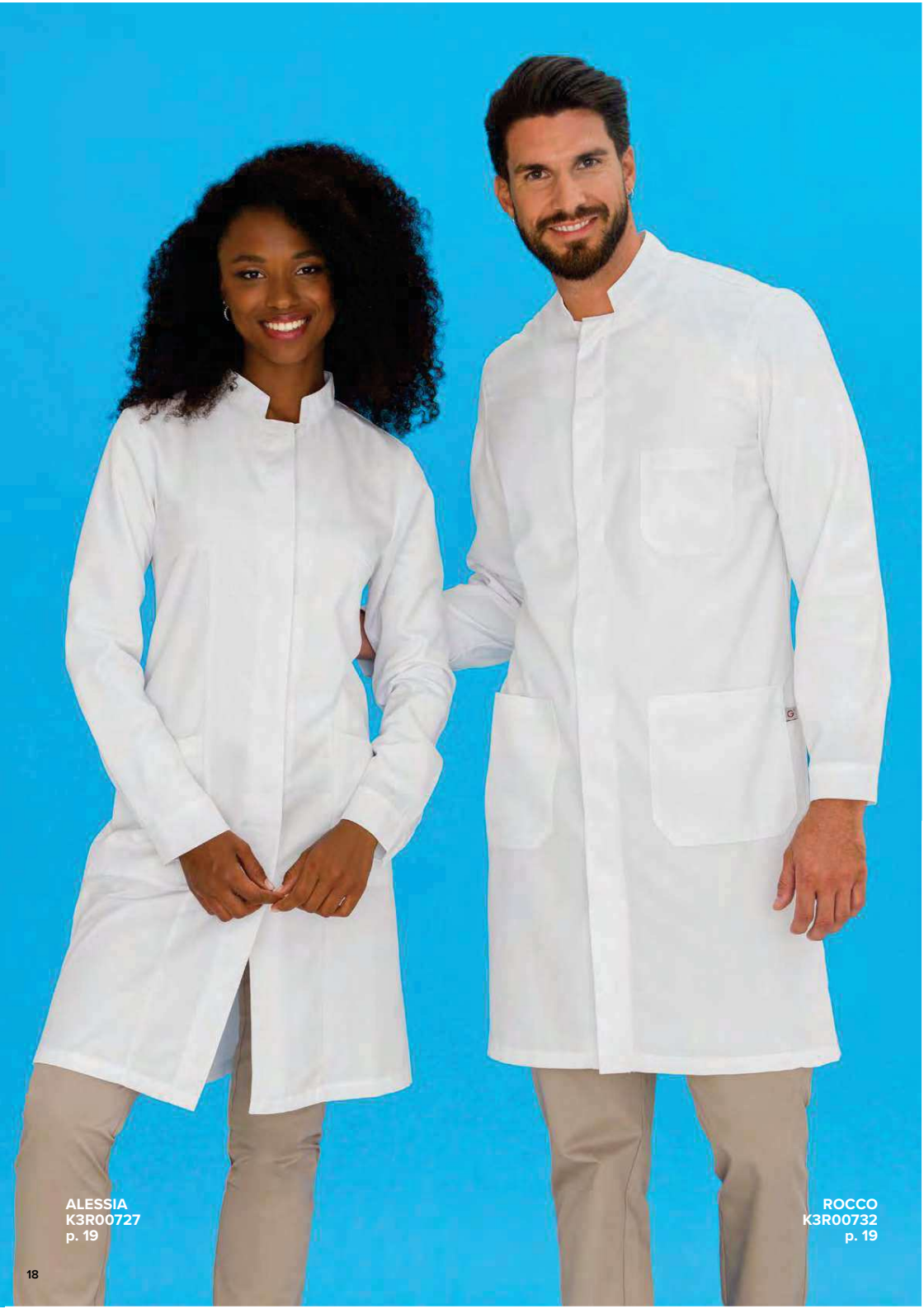
ALESSIA K3R00727 p. 19