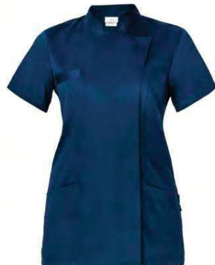
Z48 Blu Blue