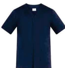
Z48 Blu Blue

ACCESSORI COORDINABILI MATCHING ACCESSORIES p. 97