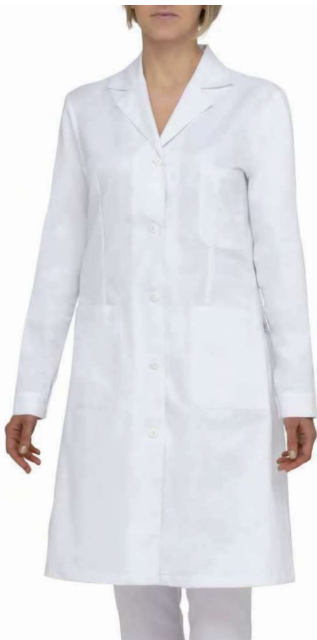
C01 Bianco White