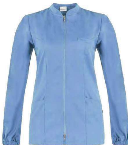
M18 Azzurro Light blue