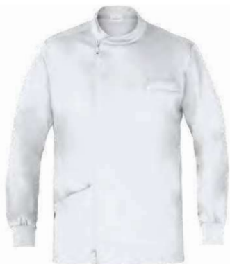
C01 Bianco White