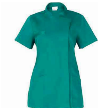
D29 Verde Green