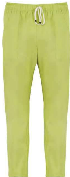
C09 Pistacchio Pistachio