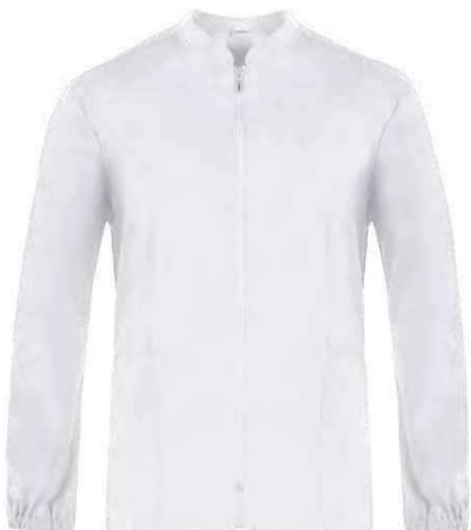
C01 Bianco White