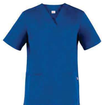
U38 Bluette Royal

ACCESSORI COORDINABILI MATCHING ACCESSORIES p. 97