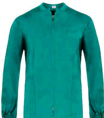
D29 Verde Green