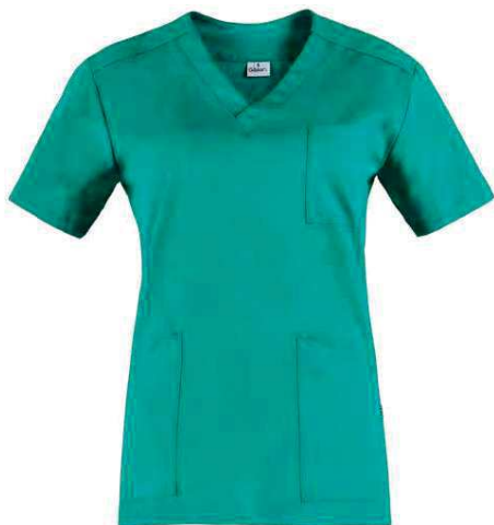
D29 Verde Green