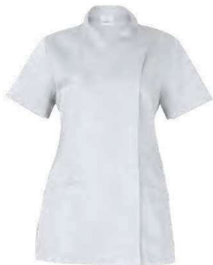
C01 Bianco White