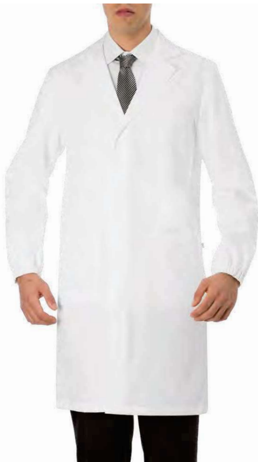
C01 Bianco White