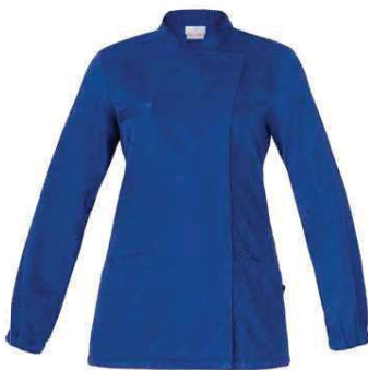
U38 Bluette Royal