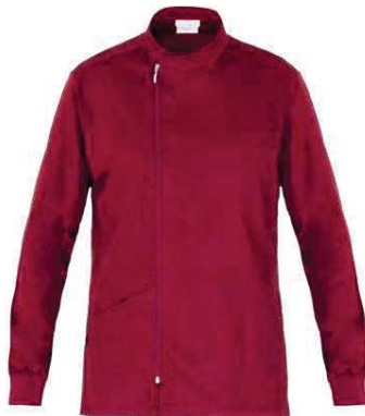
U35 Bordeaux Burgundy