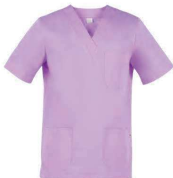
C07 Lilla chiaro Light lilac