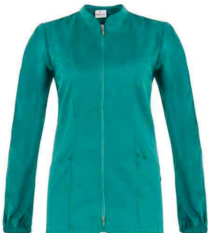
D29 Verde Green