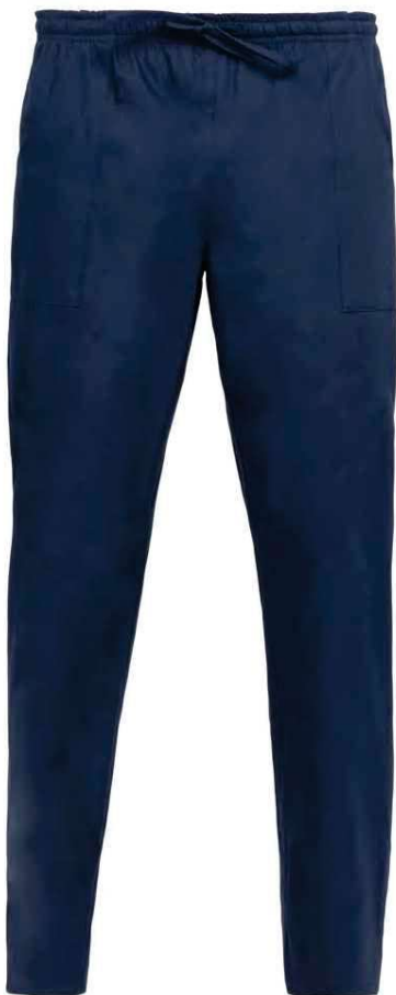
Z48 Blu Blue

ACCESSORI COORDINABILI / MATCHING ACCESSORIES p. 97