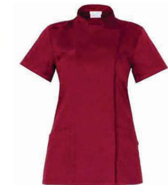
U35 Bordeaux Burgundy