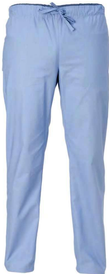
M18 Azzurro Light blue

ACCESSORI COORDINABILI / MATCHING ACCESSORIES p. 97