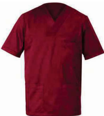
U35 Bordeaux Burgundy