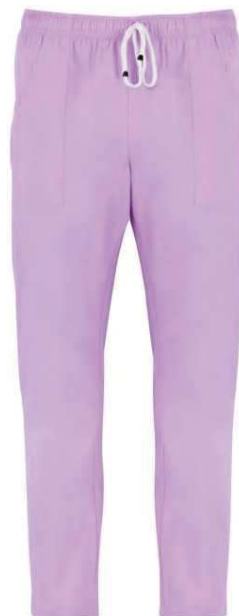
C07 Lilla chiaro Light lilac