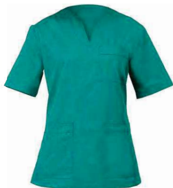
D29 Verde Green