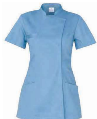
M18 Azzurro Light blue