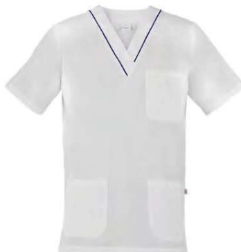
P48 Profilo blu Blue piping