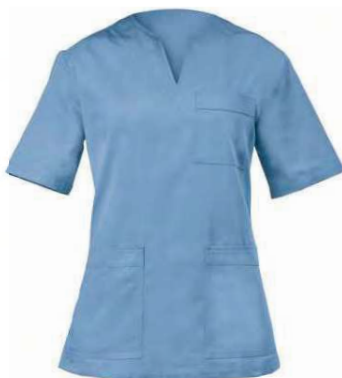
M18 Azzurro Light blue