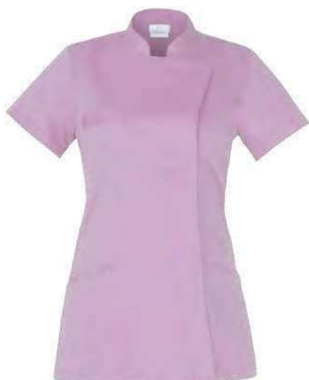
C07 Lilla Lilac